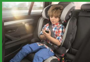
Автокресло группы II и III (для детей массой 15-36 кг)