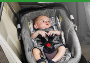
Автокресло «люлька» группы 0 (для детей массой < 10 кг)*

При покупке детского удерживающего устройства обязательно следует уточнить у продавца наличие сертификата на товар!