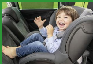
Автокресла групп I (для детей массой 9-18 кг)*